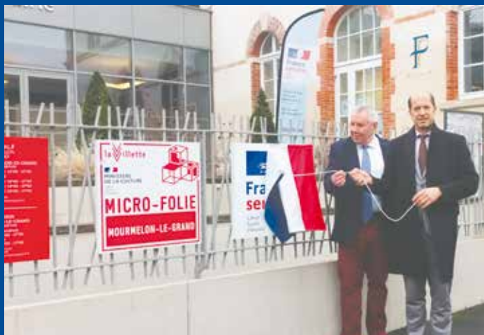
Ouverture de la structure France Services au sein de la mairie