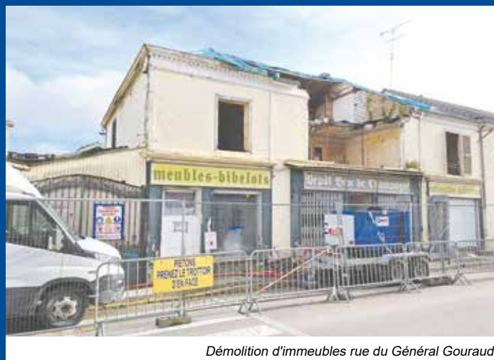
Démolition d'immeubles rue du Général Gouraud