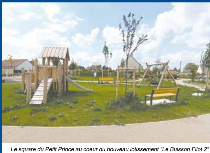
Le square du Petit Prince au coeur du nouveau lotissement "Le Buisson Filot 2"

La maîtrise d'ouvrage revient à la Communauté d'Agglomération de Châlons-en-Champagne en tant qu'autorité organisatrice de la mobilité (AOM). L'aménagement sera réalisé au cours de l'année 2025. Le coût estimatif, au stade de la faisabilité du projet, est évalué à 1 000 000 € HT et sera financé par Châlons-Agglom.