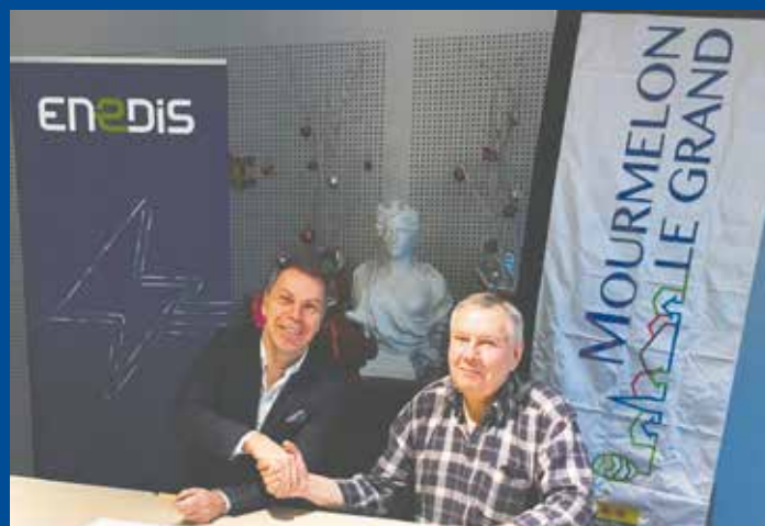
Signature de la convention de partenariat avec Enedis