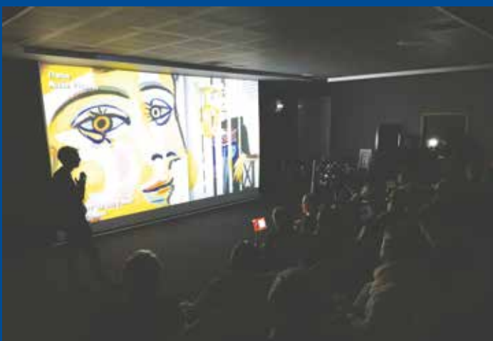
La Micro-Folie de Mourmelon-le-Grand a ouvert ses portes en 2022

Mis en service en mai 2023, cet équipement est chiffré à 68 170,00 € HT et a été subventionné à hauteur de 54 516,88 €, soit près de 80 % : 27 268 € par l'État, 14 462,88 € par la Région Grand Est et 12 786 € par le Département de la Marne.