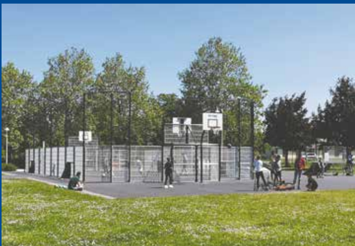
Installation d'un city-stade près du skate-park

Cette étude, menée par la CCI Marne-Ardenne, porte sur la réalisation d'un diagnostic commercial à vocation opérationnelle. Elle a été restituée en juillet dernier et son coût est de 14 616 € TTC. Une subvention de 50 %, soit 7 308 €, a été attribuée par la Région Grand Est (crédits de la Banque des Territoires).